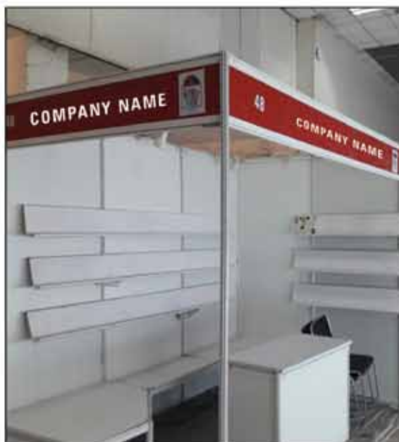
STALL 3MX2M size