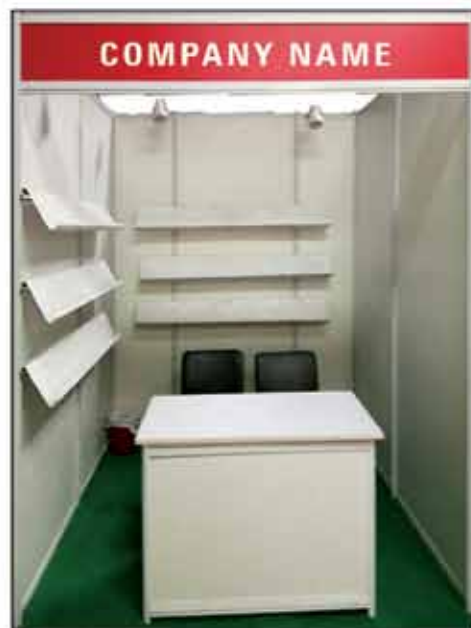
STALL 2MX2M size